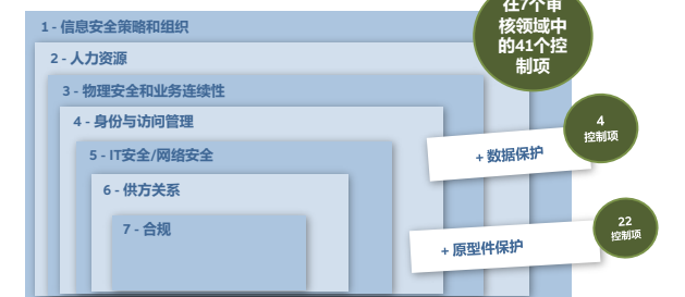
VDA ISA 提问表 在7个审核领域有41个控制项

基于 ISA 问卷的评估结果将以蜘蛛图 (见下图) 的样式显示，通过此图，可以清楚地了解每个审核领域的绩效。